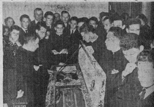
FUNERALES DE MONS. SANABRIA

El aumento de salarios en las industrias podría ser compensado